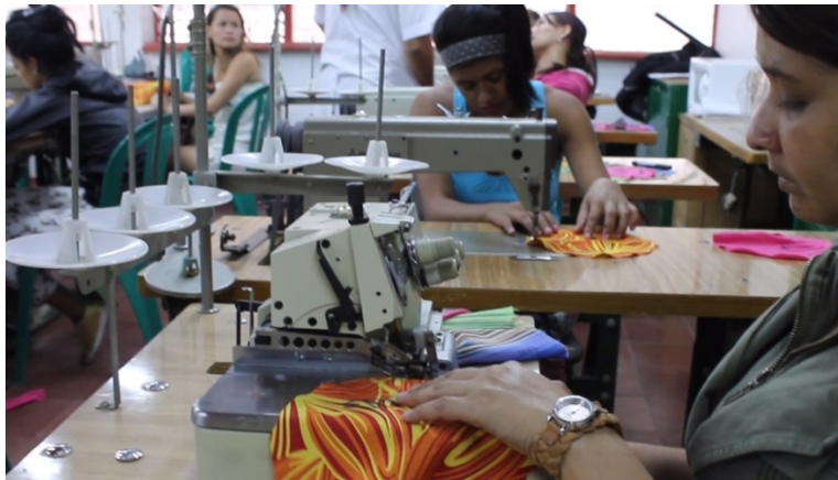
Programa de reinserción laboral - Fundación Dame la Mano

La Fundación apoyó con productos de Coltejer a organizaciones sociales que ayudan a poblaciones vulnerables. Durante el 2014 se atendieron las solicitudes de 57 instituciones, dando prioridad a 13 instituciones de formación textil, para un total de 5.474 beneficiarios.